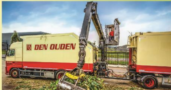
Inname Groene Reststromen