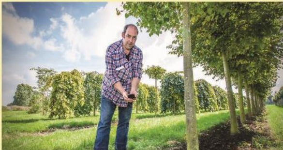
Bodemverbetersaars & Granulaten